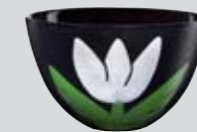
Tulipa skål Design Ulrica Hydman-Vallien Vitt på svart 179 kr